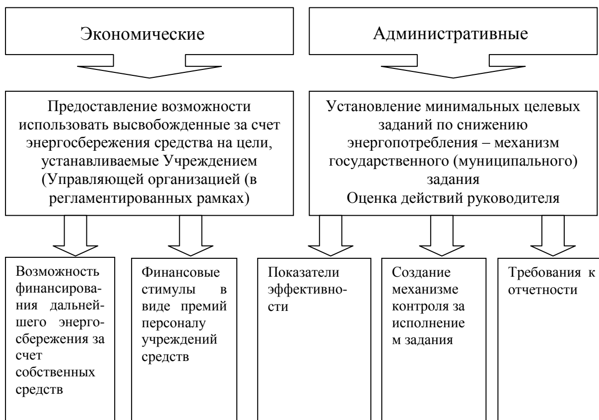
Рис. 3. Преимущества внедрения системы энергосервисных услуг [37]

Развитие системы энергосервисных услуг позволяет получить экономические и административные преимущества (рис. 3).