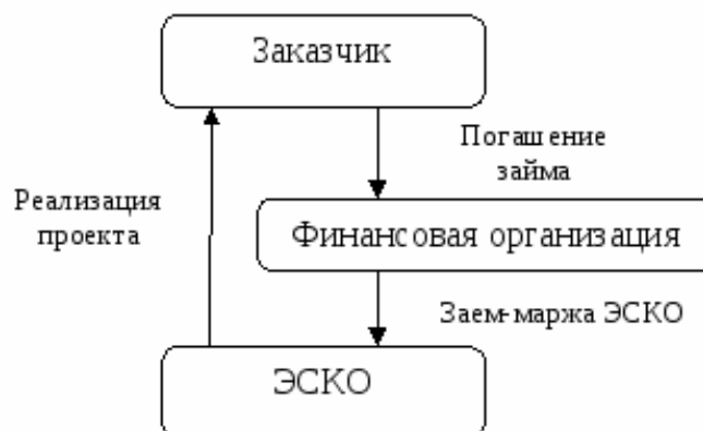
Рис. 1. Схемы вариантов механизма финансирования энергосберегающих мероприятий с использованием перформанс-контрактов [37]

На рис. 2 дана примерная схема организации энергосервисных работ в случае привлечения для выполнения работ кредитных (заемных) средств.